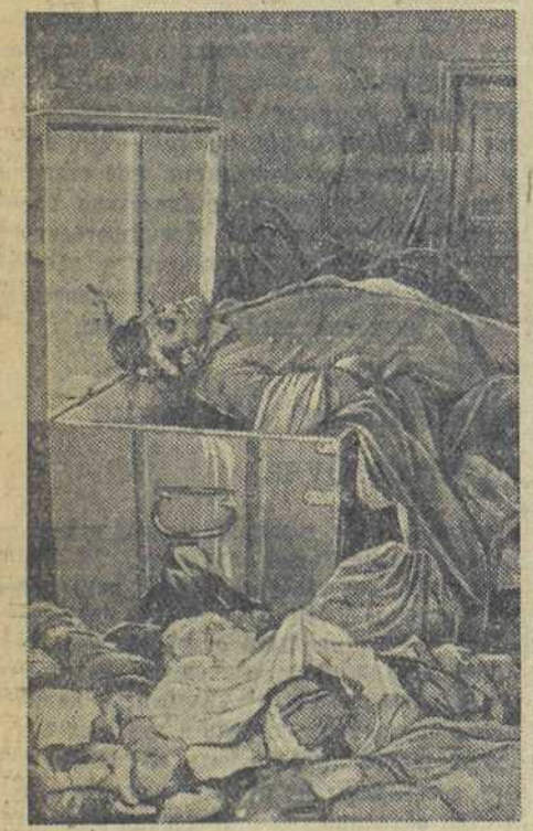
Этот гитлеровский бандит рылся в сумке колхозника на села Егоровское (Западный фронт), когда наши бойцы внезапным ударом заняли это село. Красноармейская пуля настала грабителя на месте преступления.